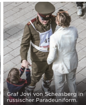
Graf Jovi von Scheasberg in russischer Paradeuniform.